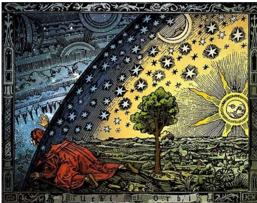
O u niverso no século XVII. Representação do universo do século XVII gravada em madeira, usada por Camille Flammarion na obra L'atmosphère: météorologie populaire (Paris, 1888). Não e xistiam outros sistemas além da esfera de estrelas fixas.

Questões como: "Qual a origem do homem?" e "O que é o universo?" fazem parte do imaginário popular e nos intrigam desde a Antiguidade, quando tentativas de respondê-las estiveram intimamente ligadas a aspectos místicos e religiosos do pensamento humano. A problemática é atualmente tratada, no escopo da pesquisa científica, pela cosmologia. Há muito encarada como um conjunto de questões mais filosóficas ou religiosas, à margem das outras disciplinas acadêmicas, a cosmologia se define como o estudo do universo – cuja concepção se alterou bastante nos últimos quatro séculos quando a Terra deixou de ser considerada o centro do universo e o Sol saiu do centro da galáxia. Nos últimos cem anos os avanços nesse campo foram enormes e se tornaram possíveis graças à evolução da computação, da física teórica e da tecnologia observacional da astronomia – como os grandes telescópios que possibilitam enxergar além dos limites do sistema solar e da galáxia. Embora a busca de respostas para as questões já colocadas, mudou de foco, as inquietações se sofisticaram e surgiram janelas teóricas e filosóficas na cosmologia. A principal delas tenta responder a: O que está causando a aceleração cósmica observada? O que é energia escura? E qual a natureza da matéria escura?